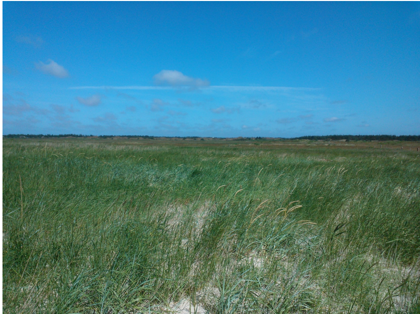
Udsigt fra stranden syd for Tirpitz-bunkeren. Bemærk at den eksisterende kuppel kun kan anes i horisonten.