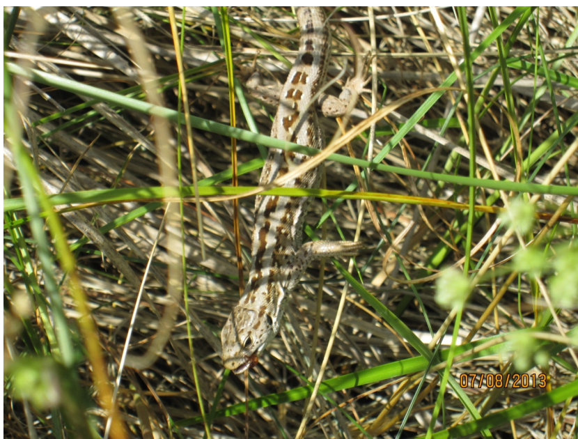
Markfirben ved Tirpitz

Udover markfirben er der ikke kendskab til forekomst af andre bilag IV-arter i det berørte område. Området har dog en karakter, der gør det velegnet som overvintrings- og rastelokalitet for bilag IV-arten strandtudse. Arten findes i denne del af kommunen, og da der er flere potentielle ynglelokaliteter inden for artens mulige vandringsafstand, vurderes det som muligt, at strandtudsens forekomster ved Tirpitz-bunkeren. Områdets betydning for strandtudsens forekomster er dog næppe væsentligt, da de potentielle ynglelokaliteter ikke virker optimale (bedømt ud fra luftfotos) og alle er beliggende i en afstand af mere end 700 m.