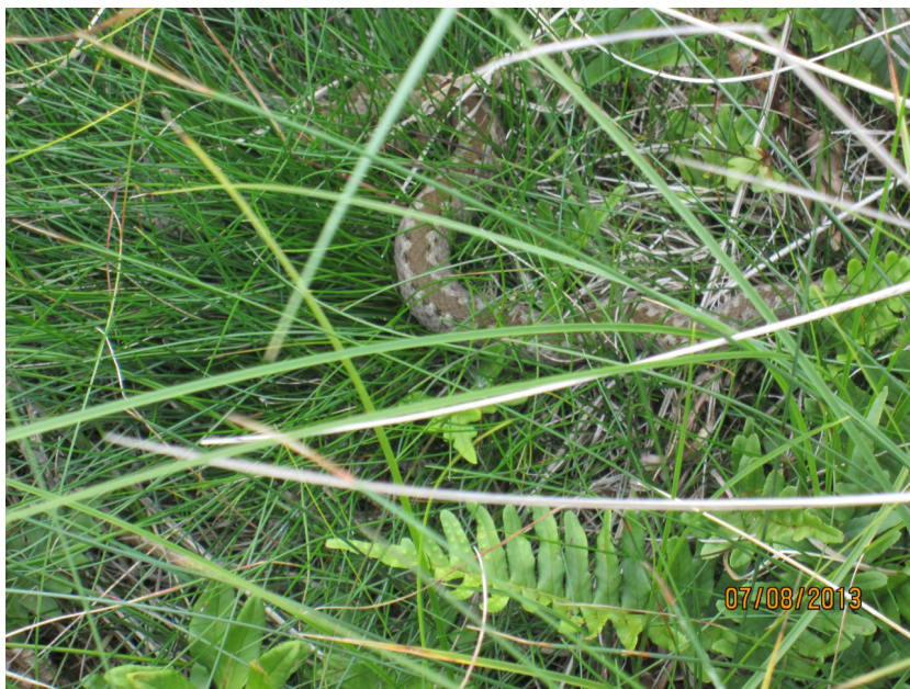
Hugorm ved Tirpitz